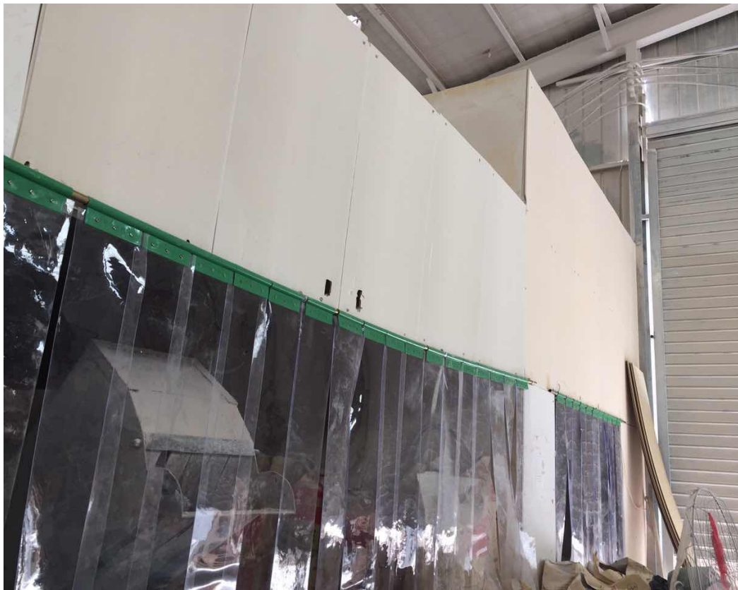
破碎车间加装格挡以减少无组织颗粒物排放