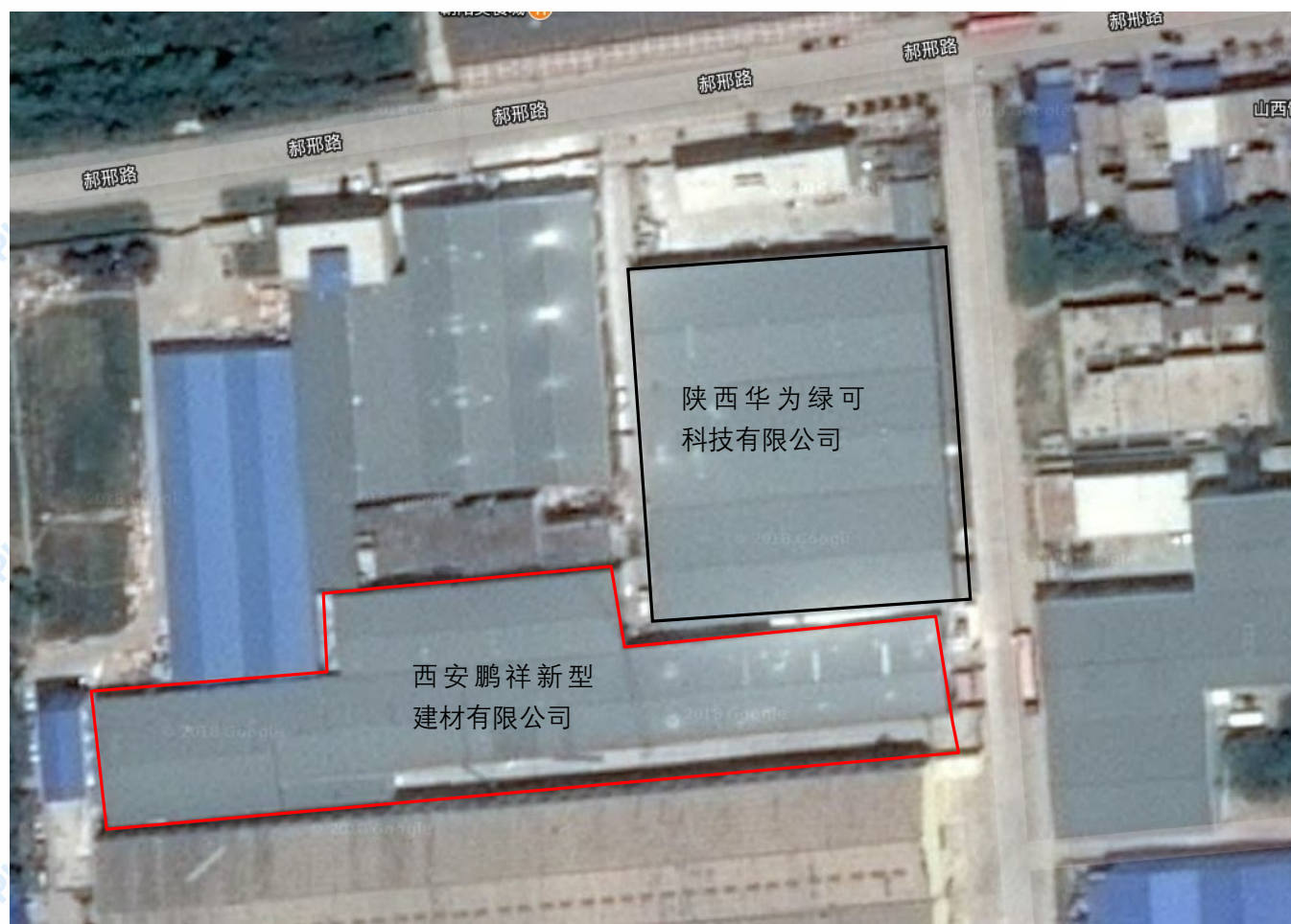
图 3-2 项目四邻关系图