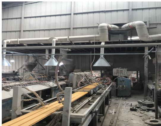
碱液吸收装置集气罩